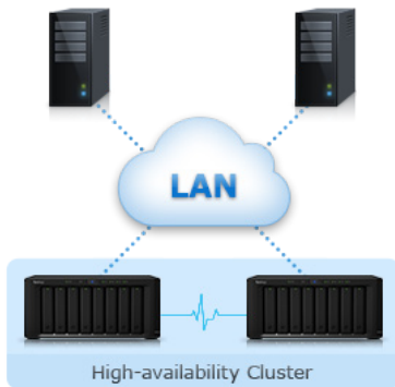
Abbildung 1) Zuverlässigkeit, Verfügbarkeit & Wiederherstellung

Synology High Availability stellt den nahtlosen Wechsel zwischen zwei Cluster-Servern mit minimalen Auswirkungen auf Unternehmen sicher, falls ein Serverausfall auftreten sollte.