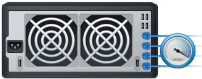
Abbildung 2) Erstklassige Leistungsfähigkeit

Synology High Availability stellt den nahtlosen Wechsel zwischen zwei Cluster-Servern mit minimalen Auswirkungen auf Unternehmen sicher, falls ein Serverausfall auftreten sollte.